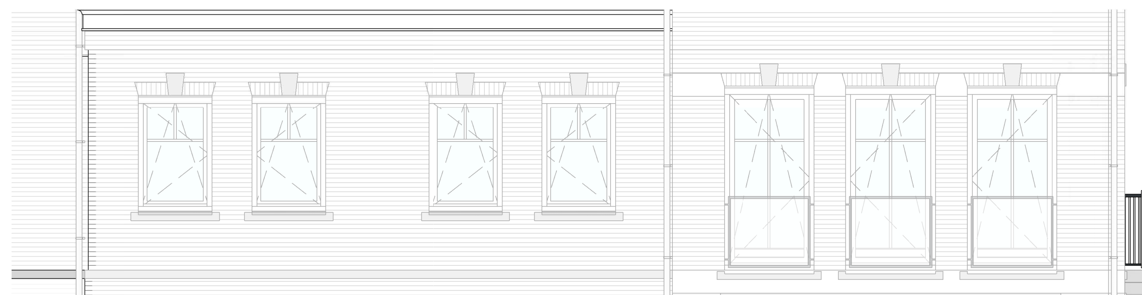
Zijgevel bouwnummer 32

Posities en aantallen van in tekening weergegeven installatieonderdelen alsmede maatvoering zijn indicatief en kunnen geen rechten aan ontleend worden