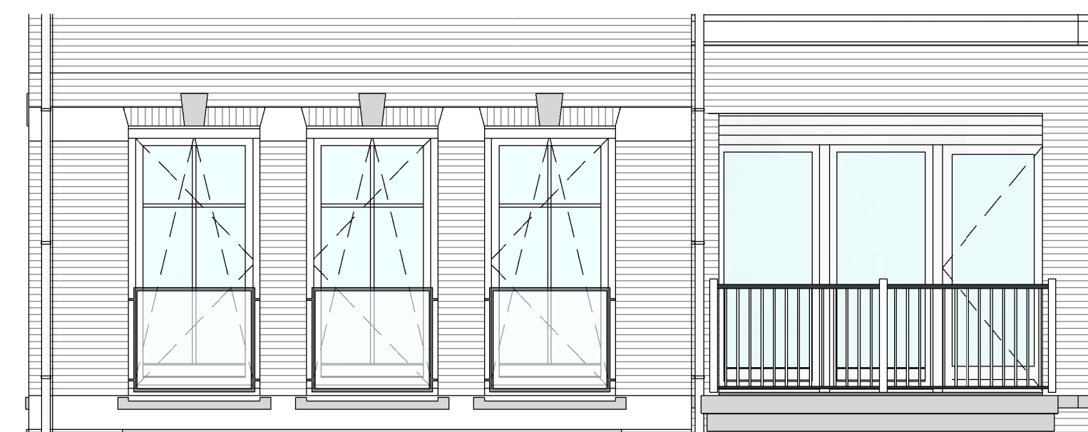
Voorgevel bouwnummer 32